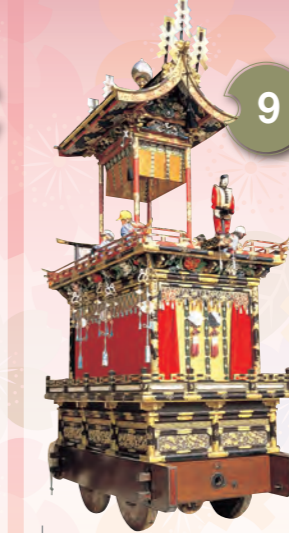
9 こんこうたい 崑崗台