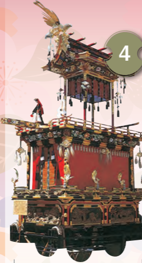
4 しゃっきょうたい 石橋台