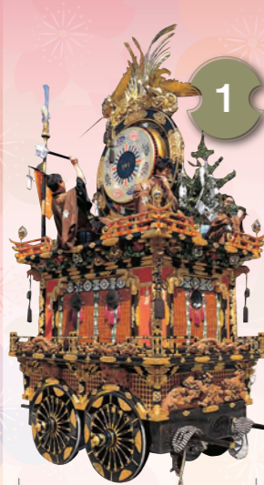
1 かぐらたい 神楽台