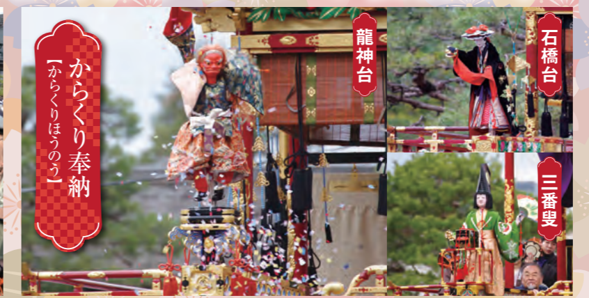
「からくりほうのう」 からくり奉納

300年続く行事で、神輿を中心に獅子、闘鶏衆、袴姿の警固など伝統の装束をまとった数百名が、町を練り歩きます。出発は14日午後、日枝神社を出て家々を巡り、中橋の御旅所へ。神輿は一泊し、15日午後より御旅所から神社へ還御されます。 ※御旅所前での行事催行中は、付近において歩行禁止などの通行規制を行います。