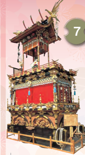
7 えびすたい 恵比須台