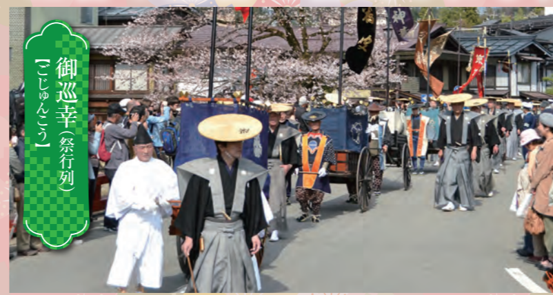
「ごしんらい」 御巡幸(祭行列)

300年続く行事で、神輿を中心に獅子、闘鶏衆、袴姿の警固など伝統の装束をまとった数百名が、町を練り歩きます。出発は14日午後、日枝神社を出て家々を巡り、中橋の御旅所へ。神輿は一泊し、15日午後より御旅所から神社へ還御されます。 ※御旅所前での行事催行中は、付近において歩行禁止などの通行規制を行います。