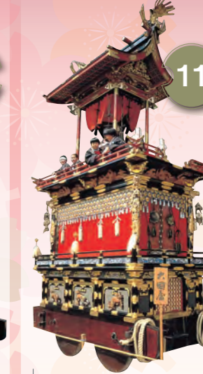
11 だいこくたい 大國台