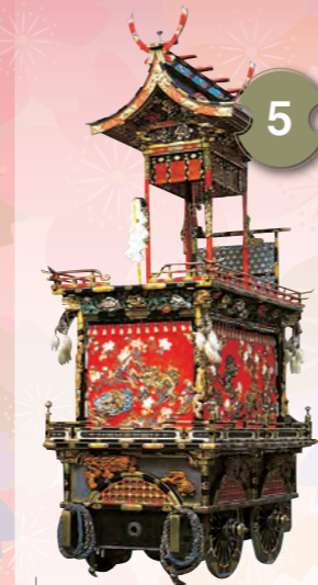
5 ごたいさん 五台山