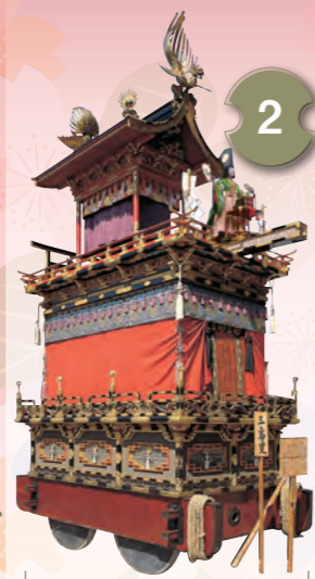
2 さんぼそう 三番叟