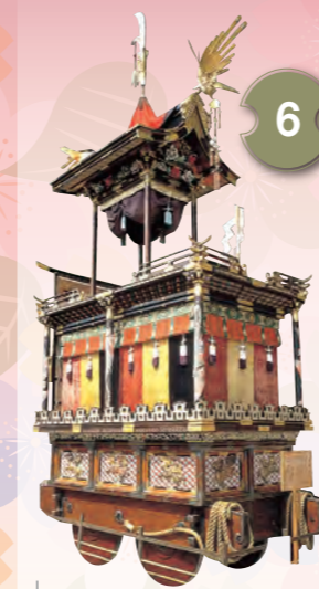
6 ほうおうたい 鳳凰台