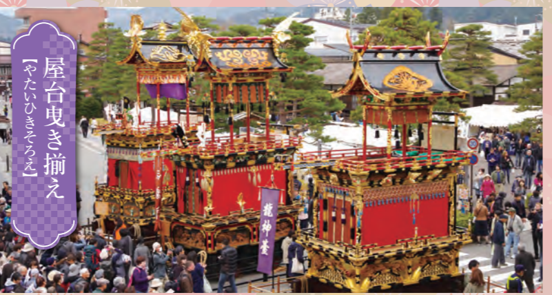
「やたいひきまわし」 屋台曳き揃え