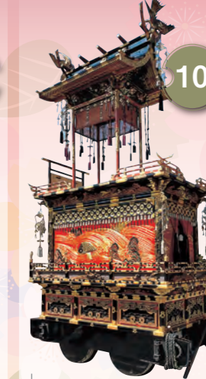
10 きんこうたい 琴高台