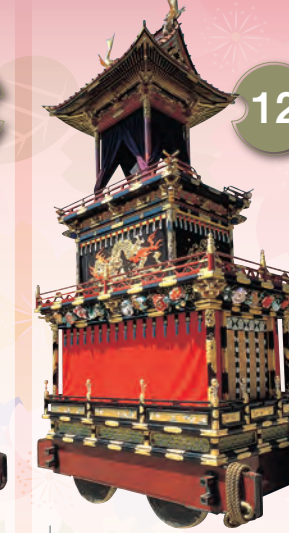
12 せいりゅうたい 青龍台