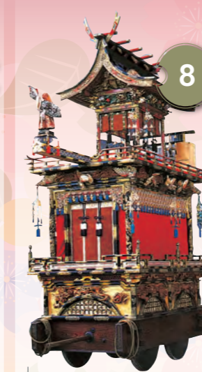
8 りゅうじんたい 龍神台