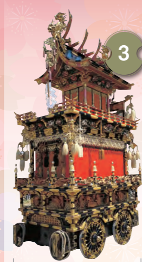
3 きりんたい 麒麟台