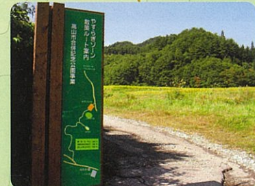
①ハイキングコース 施設案内板