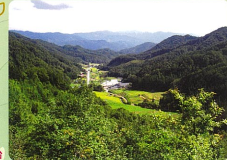
展望台からの展望 標高750m