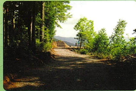
⑤進路案内板から望む展望台方向