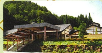
四十八滝温泉 しぶきの湯 遊湯館